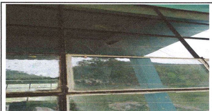
FOTO: 6 VENTANAS EN EL ÁREA DEL MÓDULO 2

Observación: Si es necesario se pueden agregar hojas adicionales y actualizar el número de hojas.